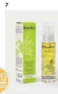
MÉDAILLES D'OR 1. Patyka pour Lift Pro Collagène (pharmacies) 2. Orveda pour Biotic Full Eyes Duo (distribution sélective) 3. Sephora (S+) (LVMH) pour Good for Skin.you.all (marques exclusives et distributeurs) 4. Yves Rocher crème verte sensitive camomille (marques exclusives et distributeurs) 5. Saint-Gervais Mont Blanc (L'Oréal DPGP) pour l'Essence du Mont Blanc (grande distribution) 6. Esthederm (Naos) Excellage contour des yeux (instituts, spas et salons de coiffure) 7. Kadalys pour l'Huile Précieuse à la banane verte bio (indies)