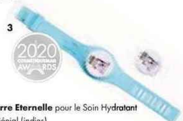
MÉDAILLES D'OR 1. Nailmatic pour Bath Bomb Maker (distribution sélective) 2. Terre Eternelle pour le Soin Hydratant Visage Hydra Cocoon (indies) MÉDAILLE D'ARGENT 1. Ouate pour Mon Baume Génial (indies)