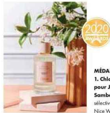
MÉDAILLE D'OR 1. Chloé (Coty) pour Jasminum Sambac (distribution sélective) présenté par Nice Work