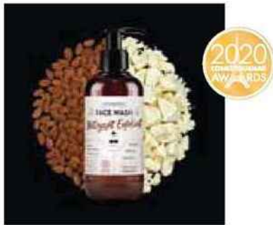
MÉDAILLE D'OR Monsieur Barbier pour la Face Wash Nettoyant Exfoliant (indies)