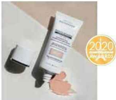
MÉDAILLE D'OR Esthederm (Naos) pour la Crème Solaire Visage Reverse Teinté (instituts, spas et salon de coiffures)