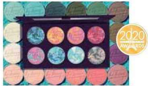
MÉDAILLE D'OR By Terry pour la Palette Factory (distribution sélective)