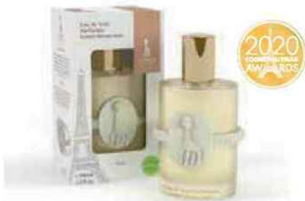
MÉDAILLE D'OR 1. Sophie la girafe (Angel Cosmetics) (distribution sélective)