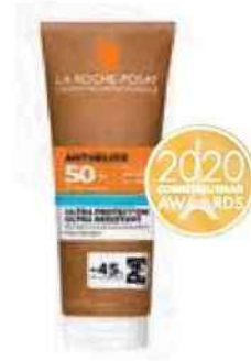
MÉDAILLE D'OR Albéa pour La Roche-Posay (L'Oréal) (Anthelios Lait hydratant écoresponsable SPF50+)