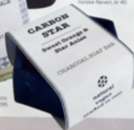
Kull-såpestykke fra norske Neven, kr 40