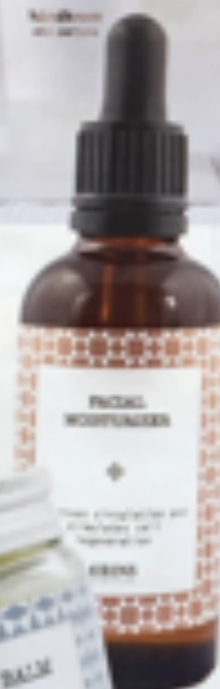
Ansiktskrem fra Mirins Copenhagen, kr 325