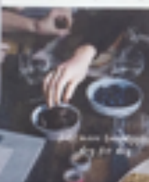
Sustain Yearly er et dansk magasin om bærekraftig livsstil. Sustaindaily.dk