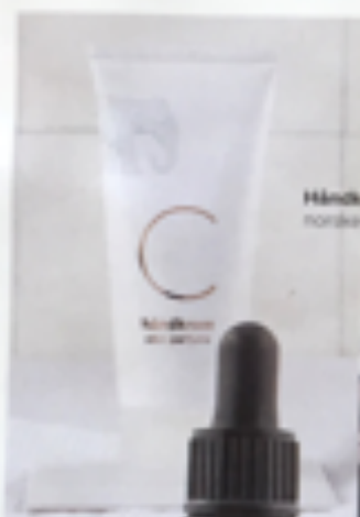
Håndkrem fra norske C Soaps, kr 199