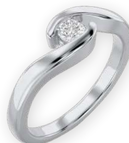
Bague solitaire en vague Diamant rond Serti tension