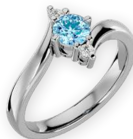
Bague en vague triple diamants bicolore Diamants ronds Serti à griffes