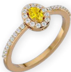
Bague ovale sertie bicolore