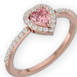
Bague coeur sertie bicolore Diamants coeur et ronds Serti halo et rail