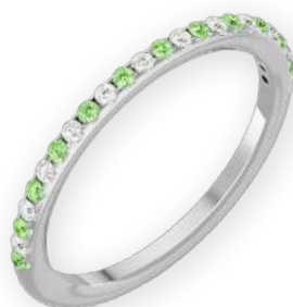
Anneau serti bicolore Diamants ronds Serti pavé français