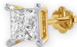
Clous d'oreilles sertis d'un diamant Diamant princesse Serti à griffes