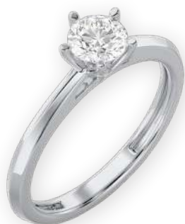
Bague solitaire Diamant rond Serti à griffes