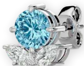
Clous d'oreilles triple diamants bicolores Diamants rond et marquises Serti à griffes