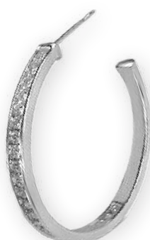
Demi-boucles serties de diamants Diamants ronds Serti pavé