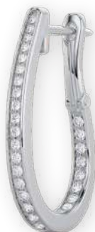
Créoles en goutte d'eau serties Diamants ronds Serti pavé