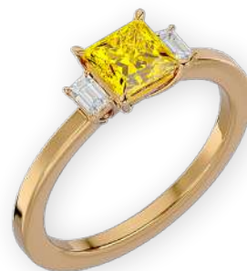
Bague princesse triple diamants bicolore Diamants princesse et émeraudes Serti à griffes