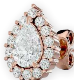
Clous d'oreilles en poire sertis Diamants poire et ronds Serti halo