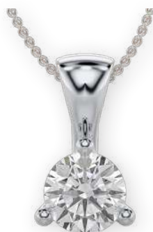
Pendentif sertie d'un diamant Diamant rond Serti à griffes