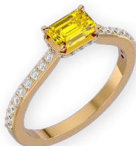
Bague émeraude sertie bicolore Diamants émeraude et ronds Serti à griffes et rail