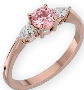
Bague bicolore triple diamants Diamants rond et poires Serti à griffes