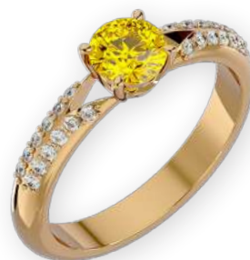
Bague en V sertie bicolore