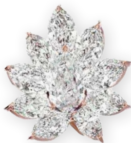
Clous d'oreilles étoilés Diamants ovale et poires Serti à griffes