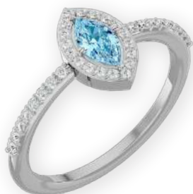
Bague marquise sertie bicolore Diamants marquise et ronds Serti halo