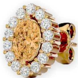
Clous d'oreilles ronds sertis bicolores