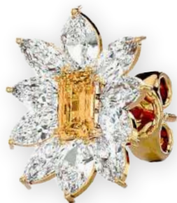
Clous d'oreilles étoilés bicolores Diamants émeraude et poires Serti à griffes