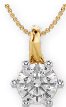
Pendentif sertie d'un diamant