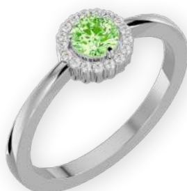
Bague ronde sertie bicolore Diamants ronds Serti halo