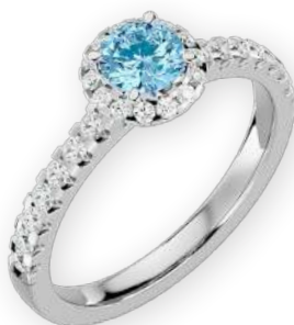
Bague ronde sertie bicolore Diamants ronds Serti halo et pavé