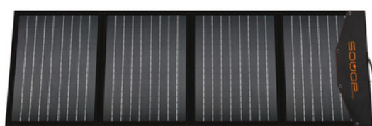
220 W SOLARPANEL

Erleben Sie die Vorteile von erneuerbarer Energie überall mit unseren faltbaren Solarpanelen! Unsere Solarpanels sind leicht, kompakt und einfach zu transportieren, sodass Sie sie überall hin mitnehmen können.