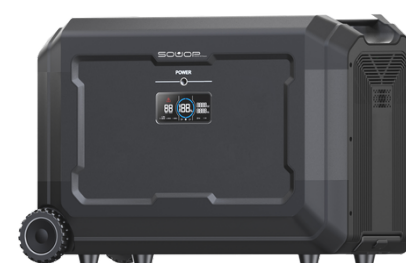
S5000 ERWEITERUNGSBATTERIE (5040WH)