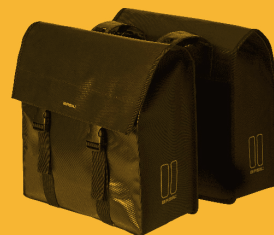
BASIL Urban Load Gepäckträgertasche