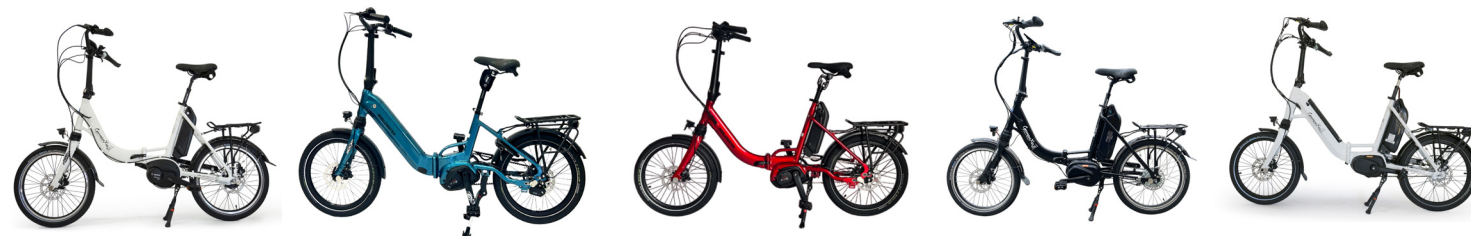
Offroad GT 8G