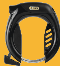
ABUS Rahmenschloss Pro Tec 4960