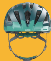
ABUS Urban City-Helm