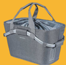
BASIL H.R.-Korb "2Day Carry All Rear Basket"