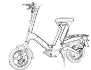
特定小型原付 電動自転車