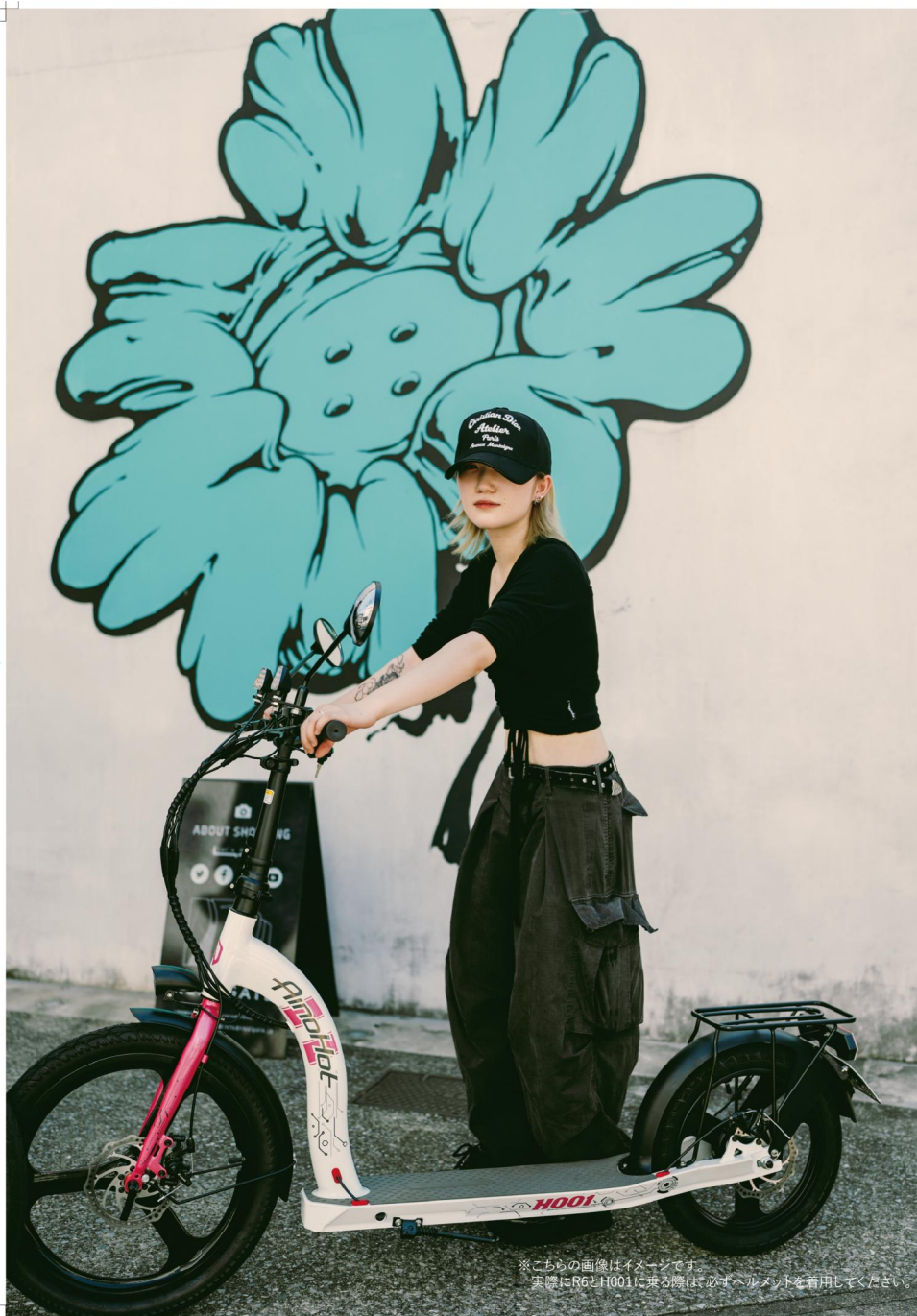
※こちらの画像はイメージです。実際にR6とH001に乗る際は必ずヘルメットを着用してください。