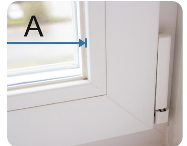
A - Bredd inklusive gummitätningar