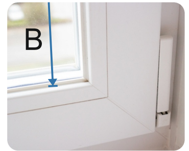
B - Höjd inklusive gummitätningar

Instruktion för beställning av plissegardiner som monteras på glaslist: