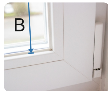
B - Höjd inklusive gummitätningar

Instruktion för beställning av aluminiumpersienn 25mm: