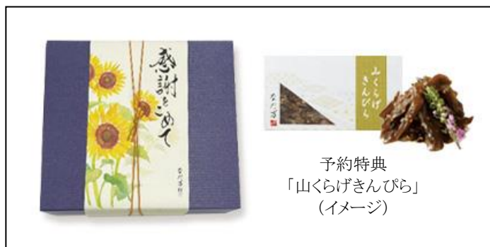
予約特典 「山くらげきんぴら」 (イメージ)