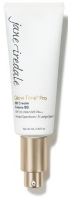
NEU! Glow Time® Pro BB Cream

Die Glow Time® BB Cream, die Sie lieben, wurde mit einem frischen Look und einer überarbeiteten 'Profi'-Formel neu erfunden.