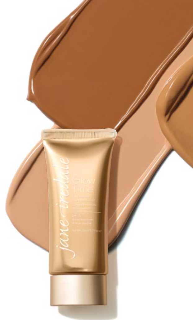
Glow Time® Full Coverage Mineral BB Cream