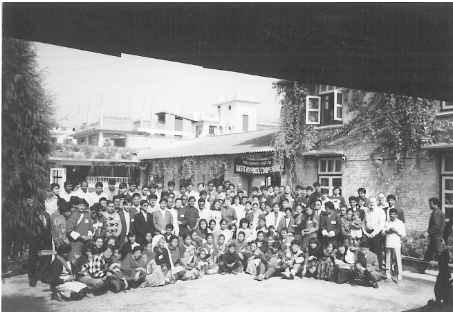
Historisches Treffen von Leitern aus Nepal, Bhutan und Indien bei einer Konferenz in Kathmandu, Nepal 1992

Bhutan und anderen Ländern nahmen an dieser Konferenz teil. Ich lehrte über das Thema Autorität . Zu dieser Zeit war nur etwa ein Prozent der Bevölkerung Nepals Christen. Schon vom ersten Tag der Konferenz an geschahen viele eindeutige Wunder, und das ging jeden Abend so weiter. Ich erklärte diesen Leitern, wie sie ihre Autorität über Krankheit und Dämonen ausüben konnten. Dies setzten sie sowohl während der Konferenz als auch später in ihren Dörfern und Städten um. Als sie Gottes Wort umsetzten, erlebten sie eine gewaltige Ausgießung des Heiligen Geistes. In ganz Nepal geschahen Zeichen und Wunder, als über Jesus gepredigt wurde.