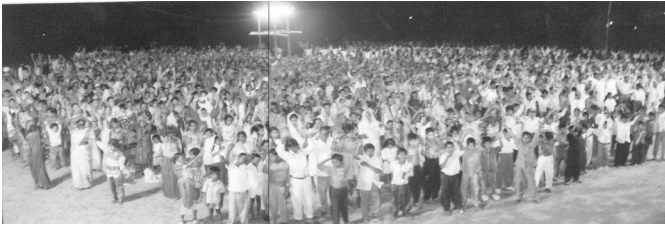
9500 Menschen kommen in Dandeli, Indien im April 1998 zum Glauben

I n diesem Buch behandeln wir, wie du dir zunutze machen kannst, was Christus uns schon vor 2.000 Jahren auf Golgatha zur Verfügung gestellt hat. So wirst du in die Lage versetzt, regelmäßig Wunder und Heilungen zu erleben.