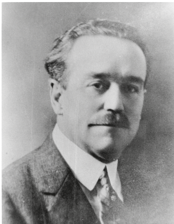
Charles F. Parham

Charles Fox Parham (1873 – 1929) wurde bekannt als einer der Vorläufer und entscheidenden theologisch einflussreichen Köpfe der Pfingstbewegung. Er begann in Topeka in Kansas eine Schule für geistlichen Dienst und wollte Studenten lehren, die Gegenwart des Geistes in tieferer Weise zu suchen. Damit sollten sie vorbereitet werden, in noch größerer Kraft aus der Höhe die Welt zu evangelisieren. Die Schule begann in einer alten Villa, genannt Stone's Folly , die aussah wie ein Schloss. Einer der beiden Türme wurde in einen Gebetsturm umgestaltet, in dem Studenten jeden Tag rund um die Uhr beteten. Als Parham Ende 1900 zu einer Reise aufbrach, gab er den Studenten die Aufgabe die Bibel zu erforschen, um den Beweis und die Gewissheit der Taufe im Heiligen Geist zu finden. Bei seiner Rückkehr erzählten sie ihm, sie hätten herausgefunden, der Beweis und die Gewissheit der