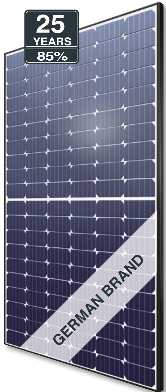
Abb. ähnlich 120MHDE20829A