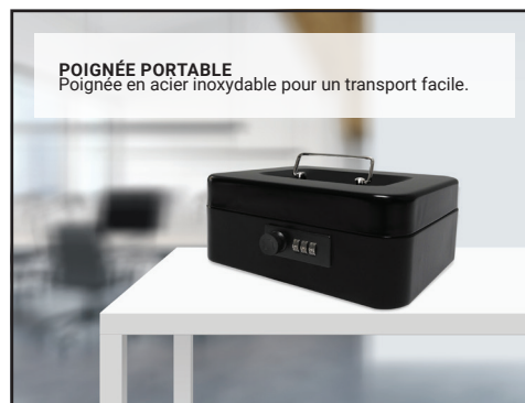
POIGNÉE PORTABLE Poignée en acier inoxydable pour un transport facile.

Manhattan - Une société de Royal Sovereign. Manhattan est fabriqué et distribué par Royal Sovereign. RS International Canada Inc. 191 Superior Blvd. Mississauga Ont. L5T 2L6 Tel: (905) 461-1095 www.royalsovereign.ca