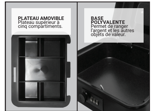
PLATEAU AMOVIBLE Plateau supérieur à cinq compartiments.