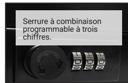
Serrure à combinaison programmable à trois chiffres.