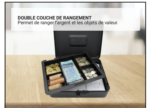
DOUBLE COUCHE DE RANGEMENT Permet de ranger l'argent et les objets de valeur.