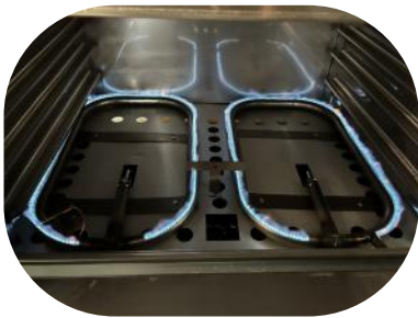
Doble quemador y Sistema Zig-Zag en Cámara