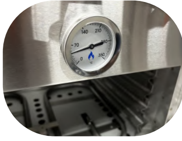
Frente y cámara Inoxidable