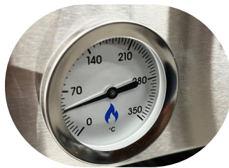
Frente y cámara Inoxidable