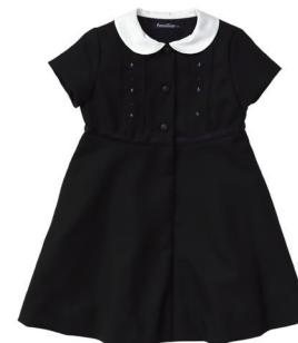
表 本体/毛・ポリエステル 衿部分/綿 裏/ポリエステル 90~120cm ¥29,700~33,000