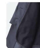
オーバーコート NB 230311

コート/ポリエステル ライナー 本体/毛 100~160cm ¥38,500~42,350