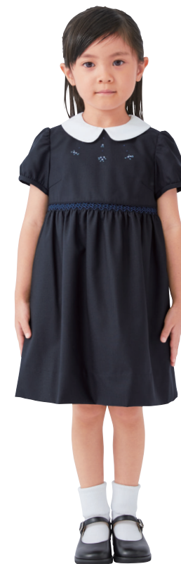
モデル:身長 102cm 着用サイズ:100

表 本体/毛 衿部分/綿 裏/ポリエステル 90~130cm ¥29,700~36,850