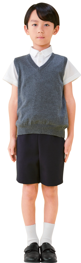
モデル:身長 125cm 着用サイズ:120