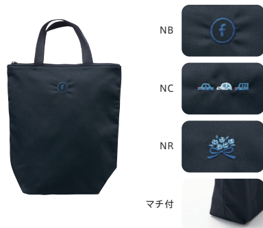
シューズバッグ NB・NC・NR 200102

表 本体/ポリエステル・綿 裏/綿 持ち手部分/ポリプロピレン 28×26×10cm ¥6,600