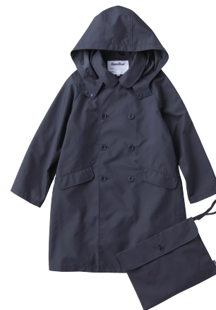
レインコート NB 230310

ポリエステル (耐久撥水・撥油・防汚) 100~140cm ¥19,800~22,000 ※収納袋付※男女兼用