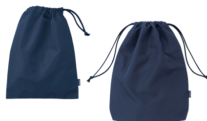
袋 (左) NB 200652