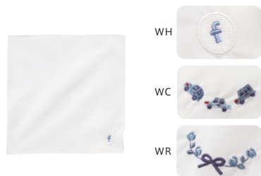
ハンカチ WH・WC・WR 200301

表 本体/ポリエステル・綿 裏/綿 持ち手部分/ポリプロピレン 28×26×10cm ¥6,600