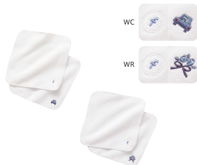
タオルハンカチセット WC・WR 200302