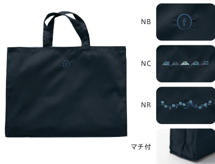
バッグ NB・NC・NR 200101