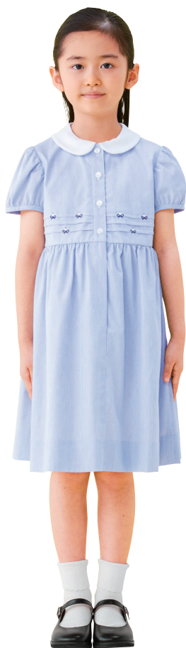
モデル:身長 122cm 着用サイズ:120