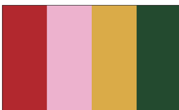
持ち手・パイピングの合成皮革(8色) レッド・ピンク・イエロー・グリーン・ブルー・ネイビー・ブラック・ホワイト