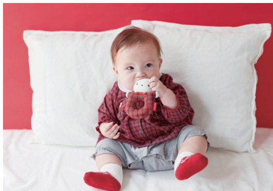
New Born 50~70cm

https://www.familiar.co.jp/stylebook/index.html