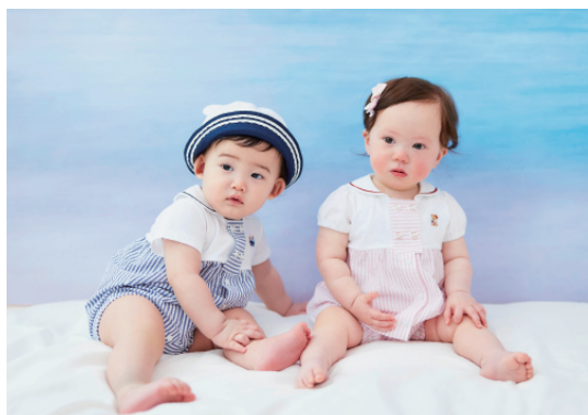
New Born 50~70cm

https://www.familiar.co.jp/stylebook/index.html