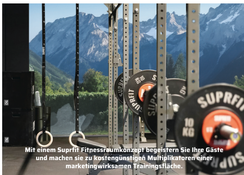
Mit einem Suprfit Fitnessraumkonzept begeistern Sie Ihre Gäste und machen sie zu kostengünstigen Multiplikatoren einer marketingwirksamen Trainingsfläche.