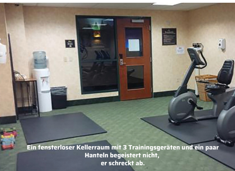
Ein fensterloser Kellerraum mit 3 Trainingsgeräten und ein paar Hanteln begeistert nicht, er schreckt ab.