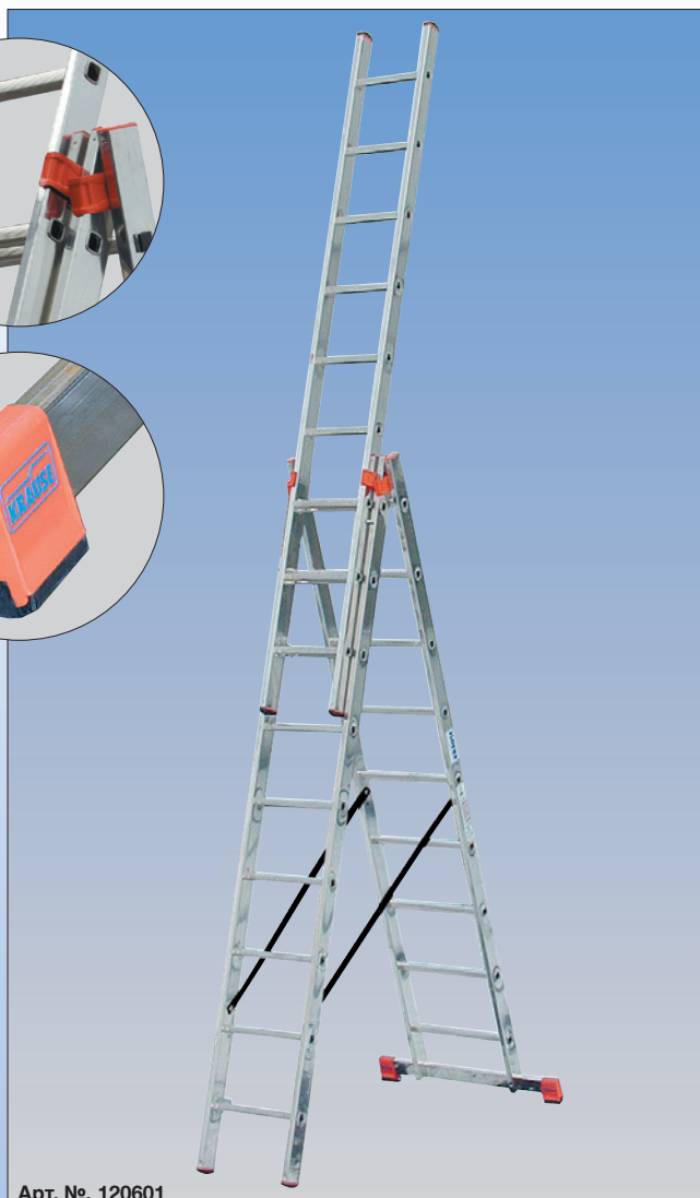
Арт. №. 120601