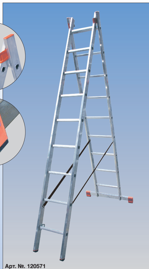
Арт. №. 120571