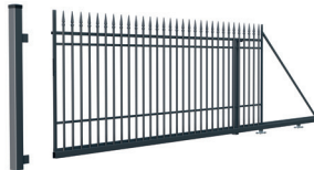
BRAMA PRZESUWNA** prawa/lewa

Szerokość: 600 (400)* cm Wysokość: 159 cm Profil sztachetek: 16 x 16 mm Ilość sztachetek: 31 Profil ramy: 40 x 40 mm Profil poprzeczki: 25 x 15 mm Kod: L: 624290, P: 624291 Kod z automatem: L: 624848, P: 624849