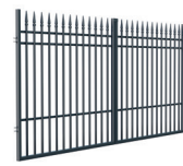
BRAMA DWUSKRZYDŁOWA 3,5 m

Szerokość: 100 (108)* cm Wysokość: 160 cm Profil sztachetek: 16 x 16 mm Ilość sztachetek: 7 Profil ramy: 40 x 40 mm Profil poprzeczki: 25 x 15 mm Kod: L: 624285, P: 624286