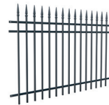
PRZĘŚŁO wys. 1,3 m

Szerokość: 200 (202)* cm Wysokość: 130 cm Profil sztachetek: 16 x 16 mm Ilość sztachetek: 15 Profil poprzeczki: 25 x 15 mm Kod: 624284