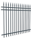
PRZĘŚŁO wys. 1,6 m

Szerokość: 200 (202)* cm Wysokość: 130 cm Profil sztachetek: 16 x 16 mm Ilość sztachetek: 15 Profil poprzeczki: 25 x 15 mm Kod: 624284