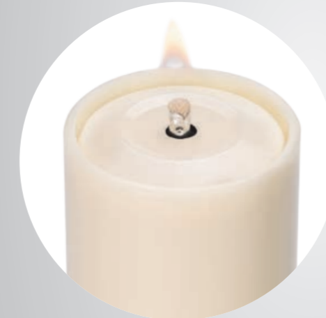
Blick auf die Sicherheitsdauerkerze