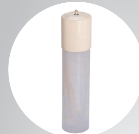
Heliotron-Ewigbrenner® mit Sicherheitszierhülle

Im Jahre 1984 wurde das Heliotron-Flüssigwachs-System erfunden. Um die nebenstehenden Nachteile zu beseitigen haben wir unsere Dauerkerze von Grund auf neu entwickelt. Lassen Sie sich von unserer neuen Sicherheitsdauerkerze überzeugen.