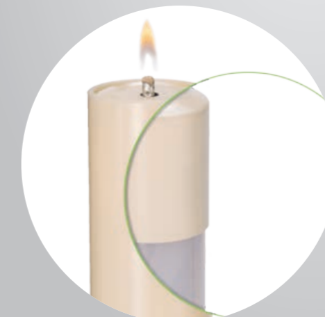
Querschnitt der Sicherheitsdauerkerze mit Heliotron-Ewigbrenner® und Sicherheitszierhülle

Nun noch mehr Natürlichkeit, noch mehr Sicherheit, längere Brenndauer und somit kostengünstiger. Jetzt mit 5 Jahren Garantie auf die Sicherheitsdauerkerze.