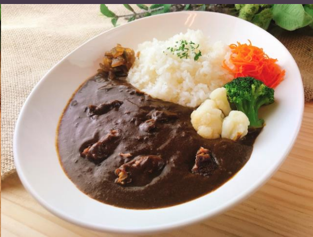
店内仕込みポークカレー(サラダ付)