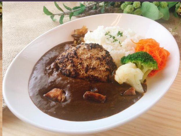
ハンバーグカレー (サラダ付)