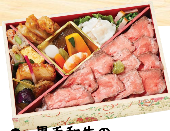
● 黒毛和牛の ローストビーフ弁当 (檜)