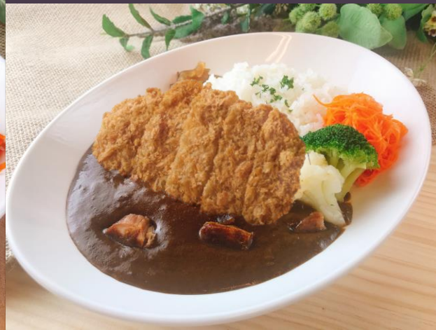
ロースカツカレー (サラダ付)