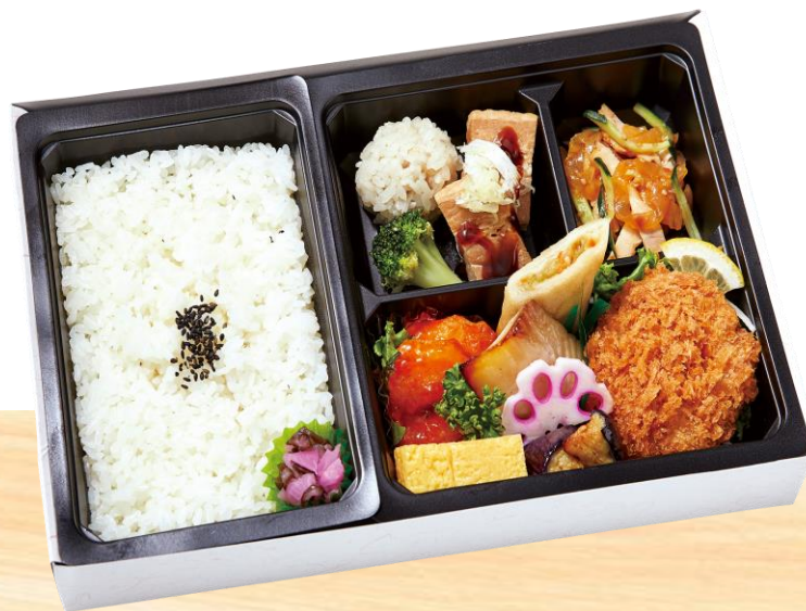
● 中華幕の弁当 (牡丹)