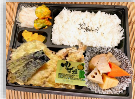
大海老天婦羅弁当 (ゆず塩)