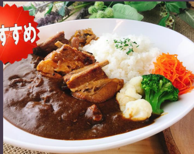
自家製スペアリブのカレー (サラダ・ドリンクバー付)