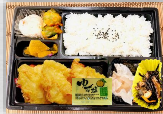
柔らか鶏天弁当 (ゆず塩)