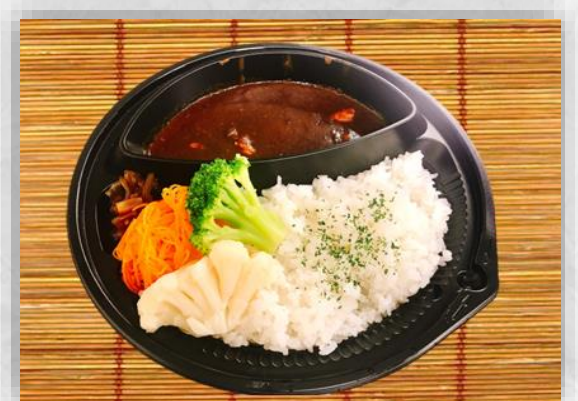
各種カレーライス