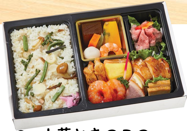
● 山菜ときのこの おこわ弁当 (柏)