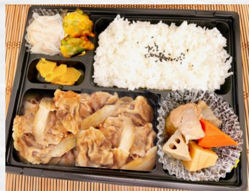
豚の生姜焼き弁当