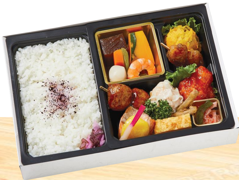
● 和風幕の内弁当 (花梨)