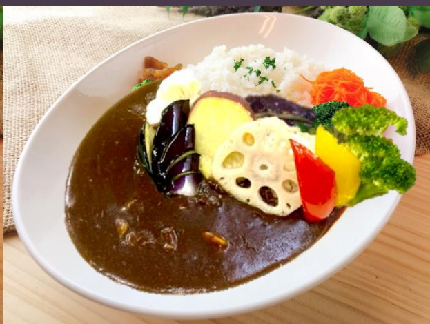
お野菜カレー (サラダ付)