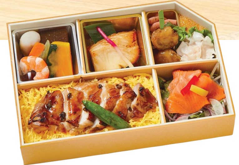
● 鶏の有馬山椒焼き 弁当 (白樺)