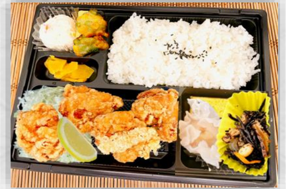
鶏のからあげ弁当 各700円