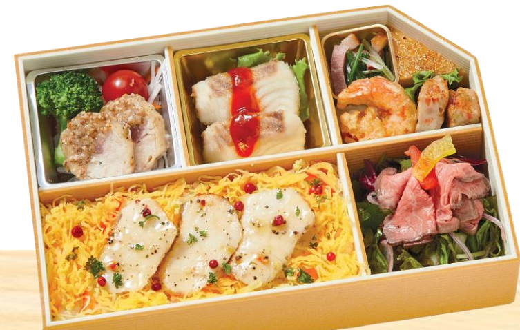
● 洋風鯛ピラフ弁当 (オリーブ)