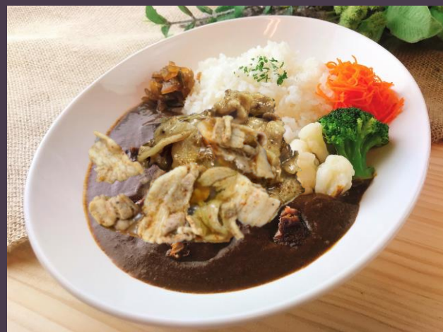
バーベキューカレー (サラダ付)

シェフこだわりのポークベースの店内仕込みカレー。 豚と野菜の旨味、スパイスの香りが合わさった、色鮮やかなでスパイシーなカレーライスです。 是非、この機会にお召し上がりください。