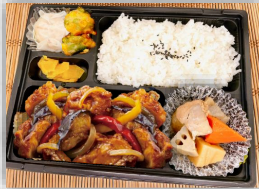
鶏と彩野菜の黒酢弁当