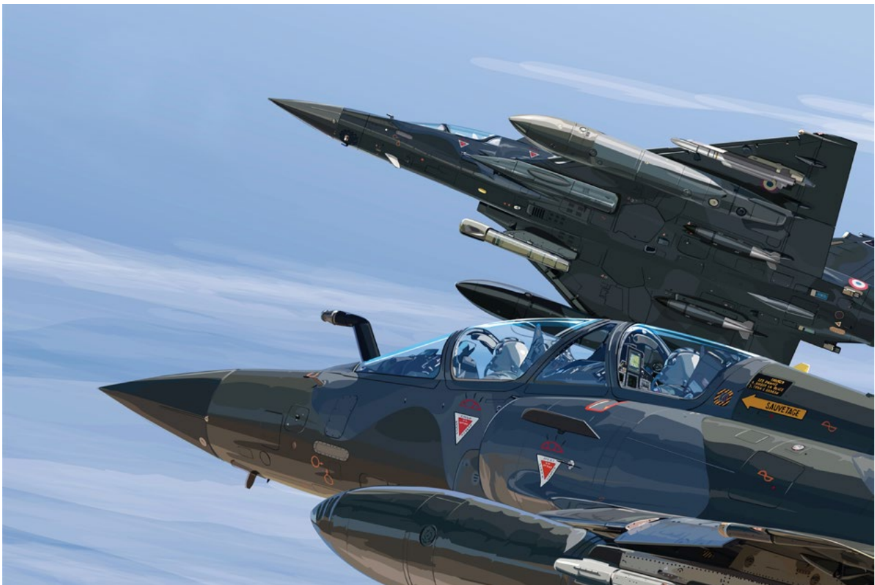
Illustration réalisée dans le cadre d'une promotion pour la rénovation à mis vie du Mirage 2000 (Client : Dassault Aviation - 2017)