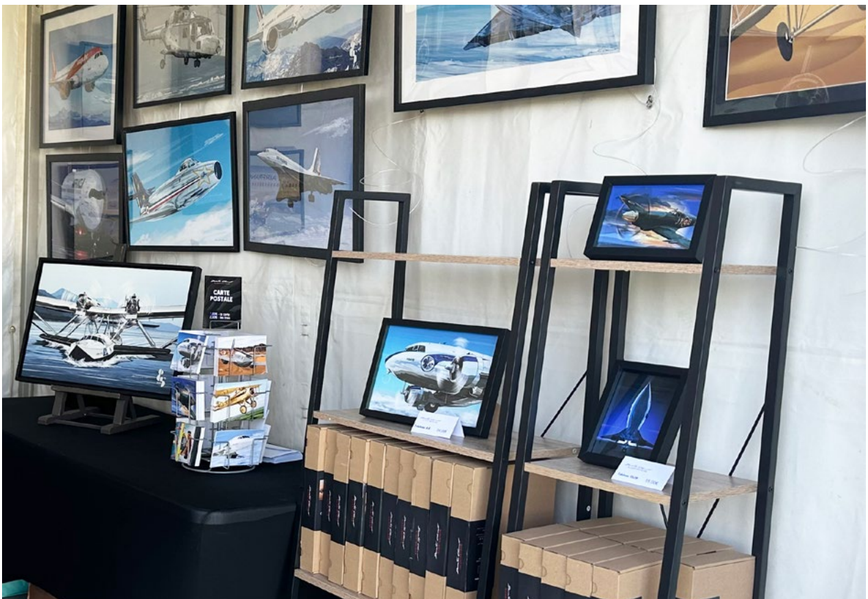
Expovente dans le village d'exposant du meeting de la Ferté Alais - 2023

Il se déplace également lors de rassemblements aériens en proposant au visiteurs une sélection d'illustration qu'il propose sur son stand.