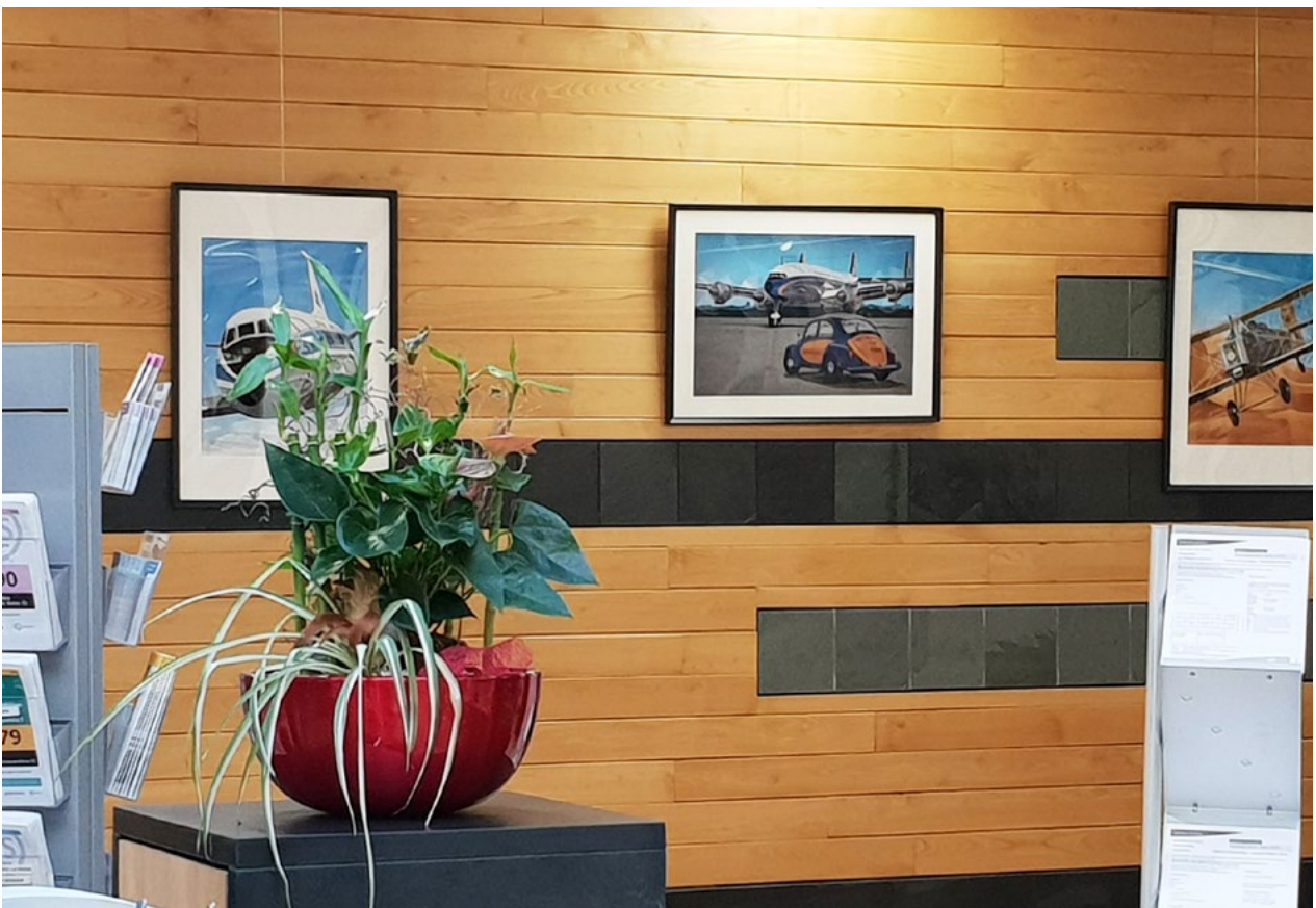
Décoration du hall de l'hôtel de ville de Vélizy-Villacoublay

Damien Charrit dispose de nombreuses œuvres disponibles qu'il met à disposition pour des expositions de courte ou moyenne durée. Il peut également vous créer sur demande des tableaux qui mettent en avant votre activité.