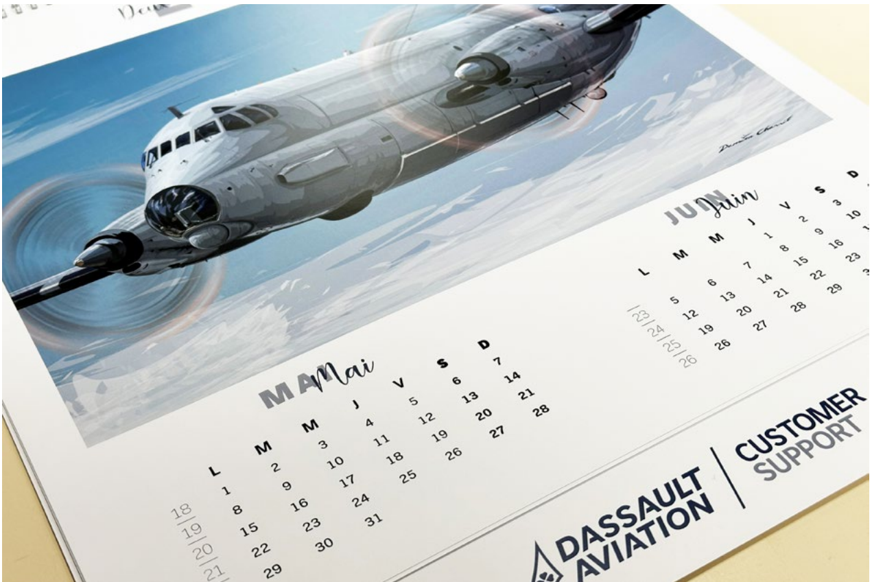
Série d'illustration qui compose un calendrier pour la division Customer Support de Dassault Aviation (Client : Dassault Aviation - 2022)