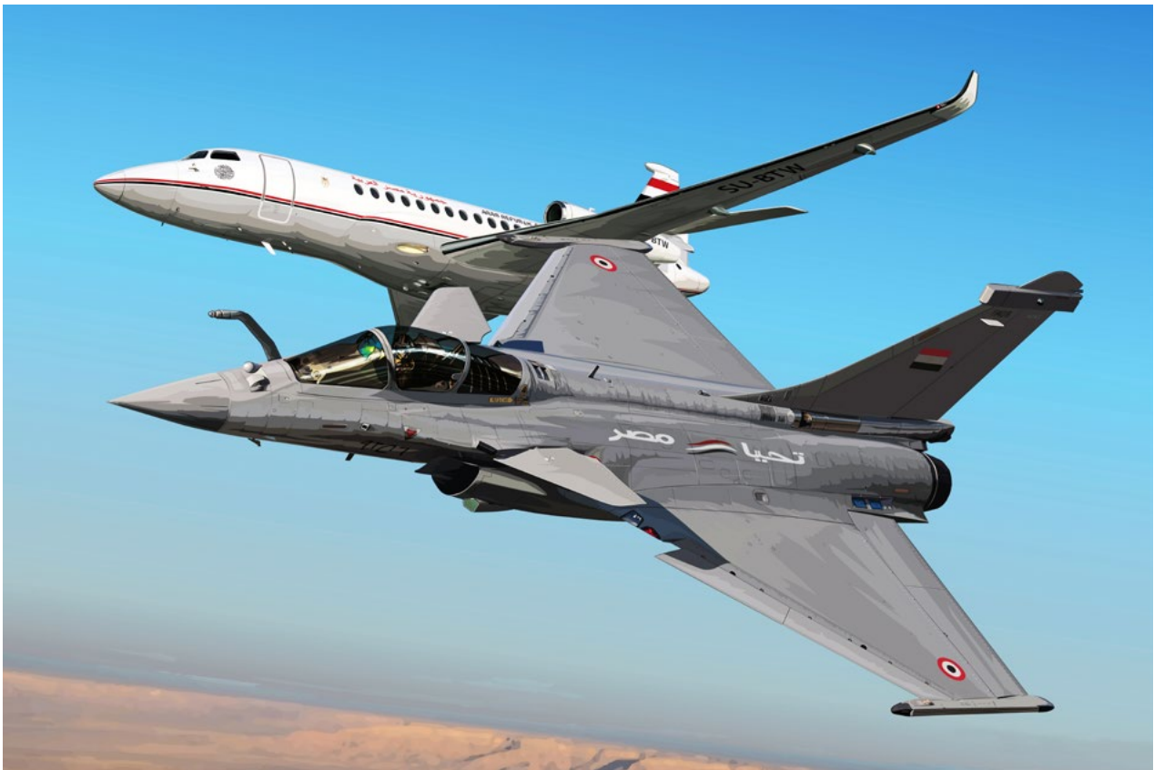
Tableau remis aux délégations égyptiennes lors de la livraison de leurs avions militaires (Client : Dassault Aviation - 2022)