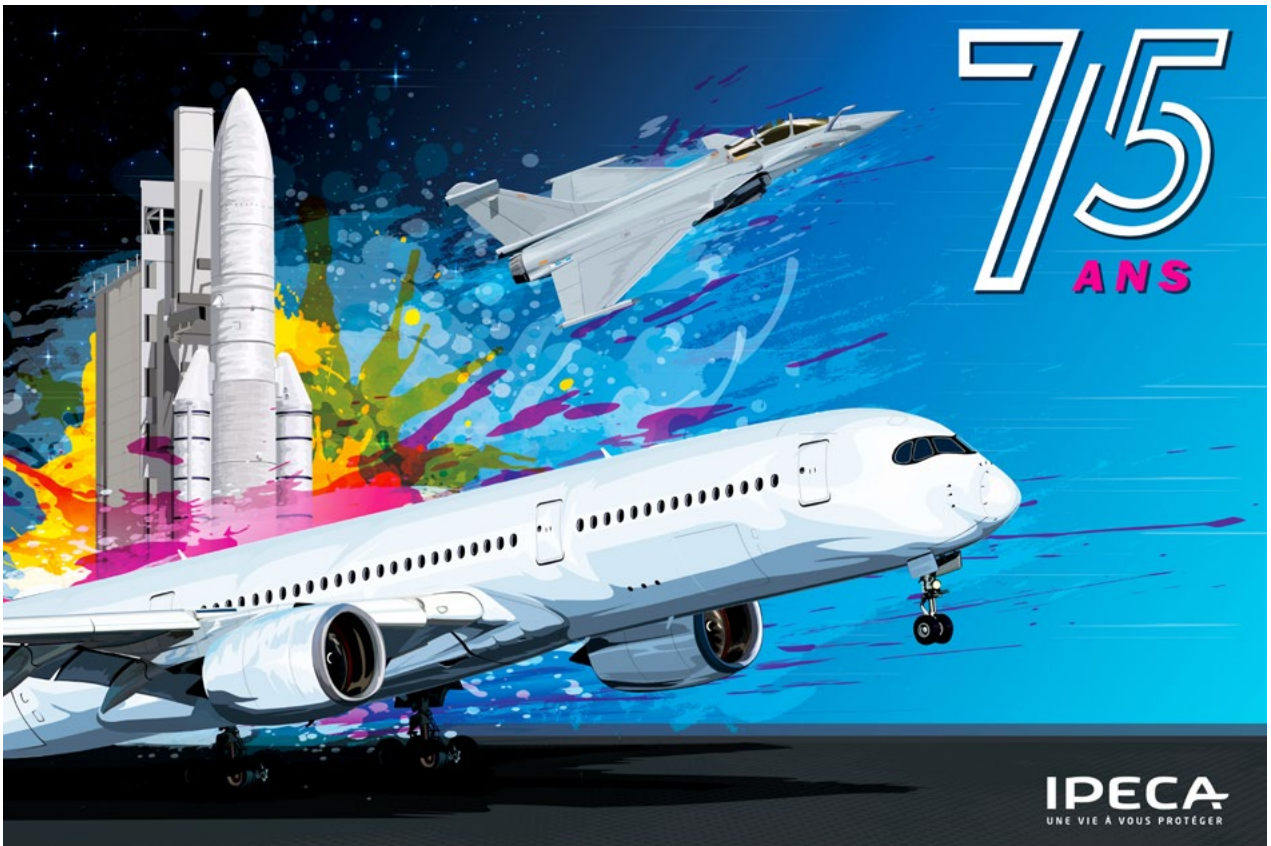
Illustration réalisée pour commémorer les 75 ans de la mutuelle IPECA très présente dans le secteur aéronautique et spatial (Client : IPECA - 2022)