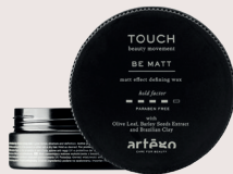
BE MATT Matt effect wax met medium-strong hold. Bevat Braziliaanse klei.