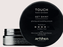
GET SHINY Glans effect wax met een medium hold. Verrijkt met Chia Olie.