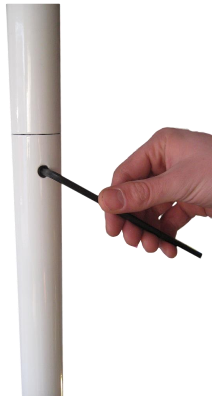
Descripción 2. Como montar Fitpole