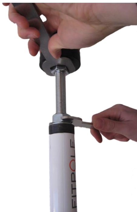
Descripción 7. Como instalar Fitpole ( https://www.facebook.com/ahlsport/videos?ref=page_internal )