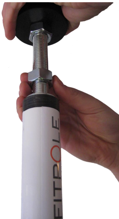
Descripción 6. Mecanismo para apretar y ajustar la parte superior al techo.

Primero, coloca la parte superior de plástico contra el techo (Descripción 6). Después con la mano, apreta la rosca inferior (Descripción 6) lo más apretado posible. Puedes fijar la barra muy fuerte entre el suelo y el techo apretando la tuerca inferior en el sentido de las agujas del reloj (Descripción 7). Ayudándote con las llaves (incluidas en el paquete) te asegurarás de que la barra esta apretada correctamente sin posibilidad de moverse (Descripción 7).