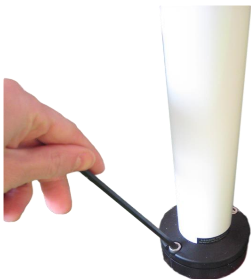
Bild. 6 Fitpole låst eller roterande ( https://www.facebook.com/ahlsport/videos )

Justering Fitpole statisk och snurra. Om du behagar at Fitpolen skall snurra. Ta bort skruvarna.