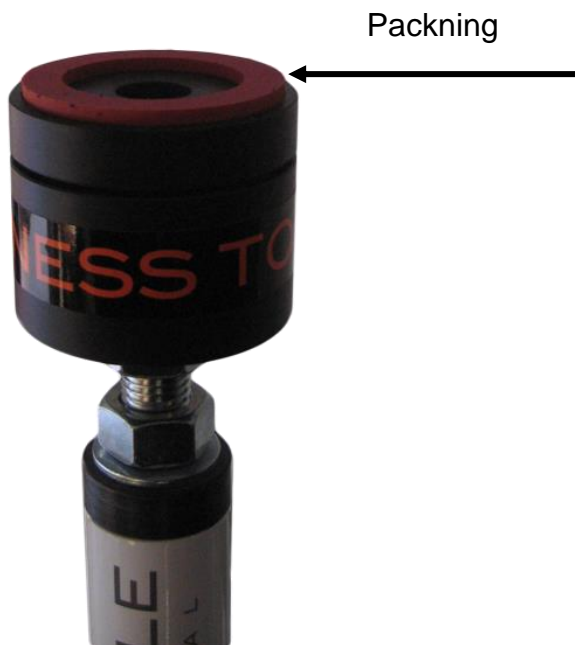
Bild 4. Packning

Fitpole är nu fixad. Sedan kan du installera packningarna (två styck) upp och nere.