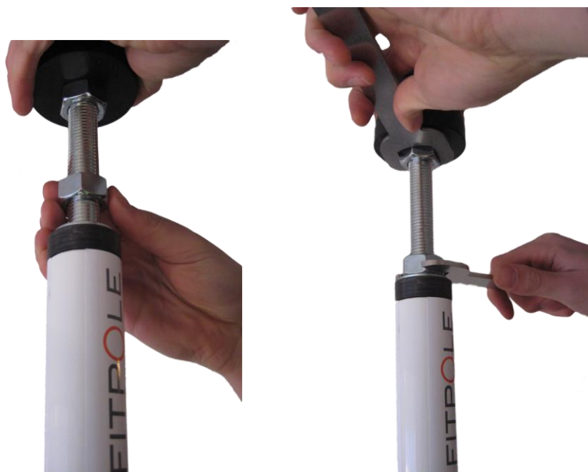
Bild 5. Övredelen justering. Använd bara Fitpole original nyclar ( https://www.facebook.com/ahlsport/videos )

Justering Fitpole statisk och snurra. Om du behagar at Fitpolen skall snurra. Ta bort skruvarna.