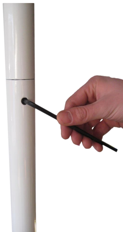
Bild 3. stäng låsskruv