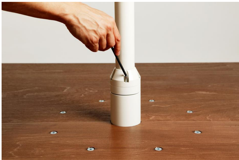
Kuva 4. Pulttien asennus

Asenna tangon pultit (5 kpl) paikalleen kuvan (kuva 4.) mukaisesti. Pyöritä tangon pultit paikalleen kuusiokoloavaimen pallomaisella päällä. Kiristä lopuksi avaimen toisella päällä pultit lopulliseen kireyteen.