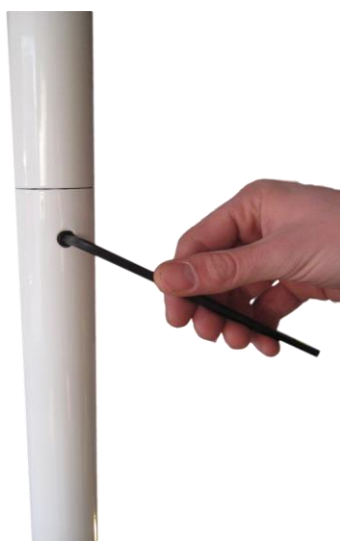
Kuva 5. Pidätinruuvin kiristäminen/avaaminen

Spinnaavassa lavamallissa tangon saa asennettua staattiseksi, kun asentaa kuvan mukaisen (kuva 6.) pultin paikalleen. Katso myös kuva 3. liittyen kohdistusreikiin. Kyseessä on samanlainen pultti kuin vanerilevyjen asentamisessa pohjalevyyn.