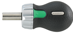
18120002 Bitratschen- Schraubendreher 1/4"