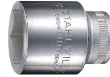
03030019 Steckschlüsseleinsätze 1/2", metrisch