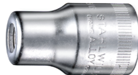
13180010 Bit-Halter 5/16"