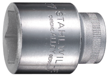
03030018 Steckschlüsseleinsätze 1/2", metrisch