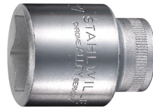
03030017 Steckschlüsseleinsätze 1/2", metrisch