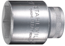
03030027 Steckschlüsseleinsätze 1/2", metrisch