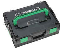
81620136 Werkzeugkasten L- BOXX