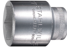
03030022 Steckschlüsseleinsätze 1/2", metrisch