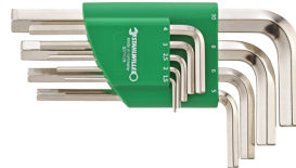
96431500 Winkelschraubendrehe r-Satz