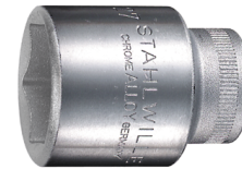
03030013 Steckschlüsseleinsätze 1/2", metrisch