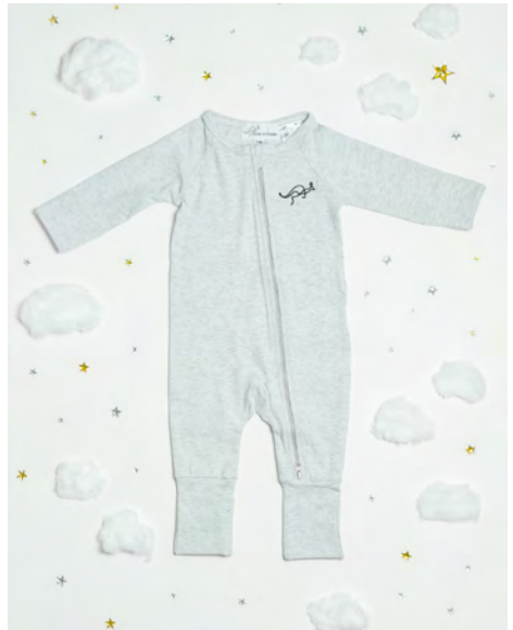
THE FREDDY ORIGINAL