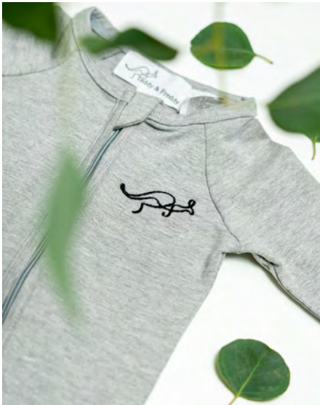
THE TEDDY ORIGINAL