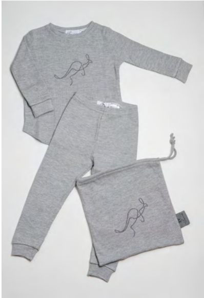
KOALA GREY LOUNGESET in Waffelpiqué-Stoff