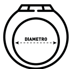
TABELLA MISURE ANELLI