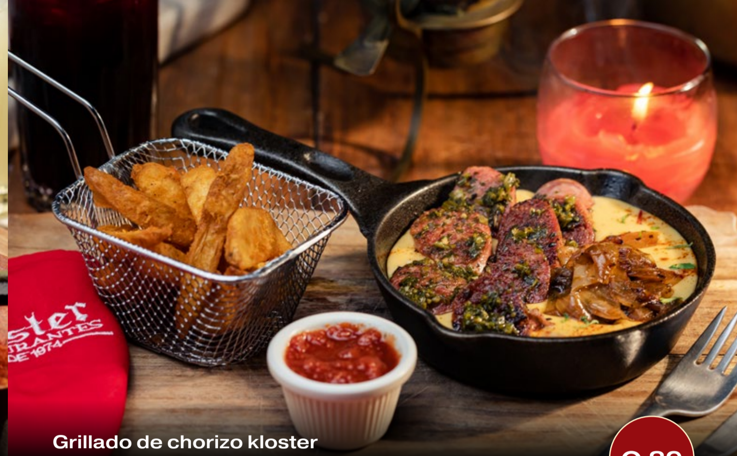
Grillado de chorizo kloster

Delicioso steak a la plancha sazonado con yerbas y especias, acompañado de dos guarniciones, una salsa a su elección y fondue-bread.