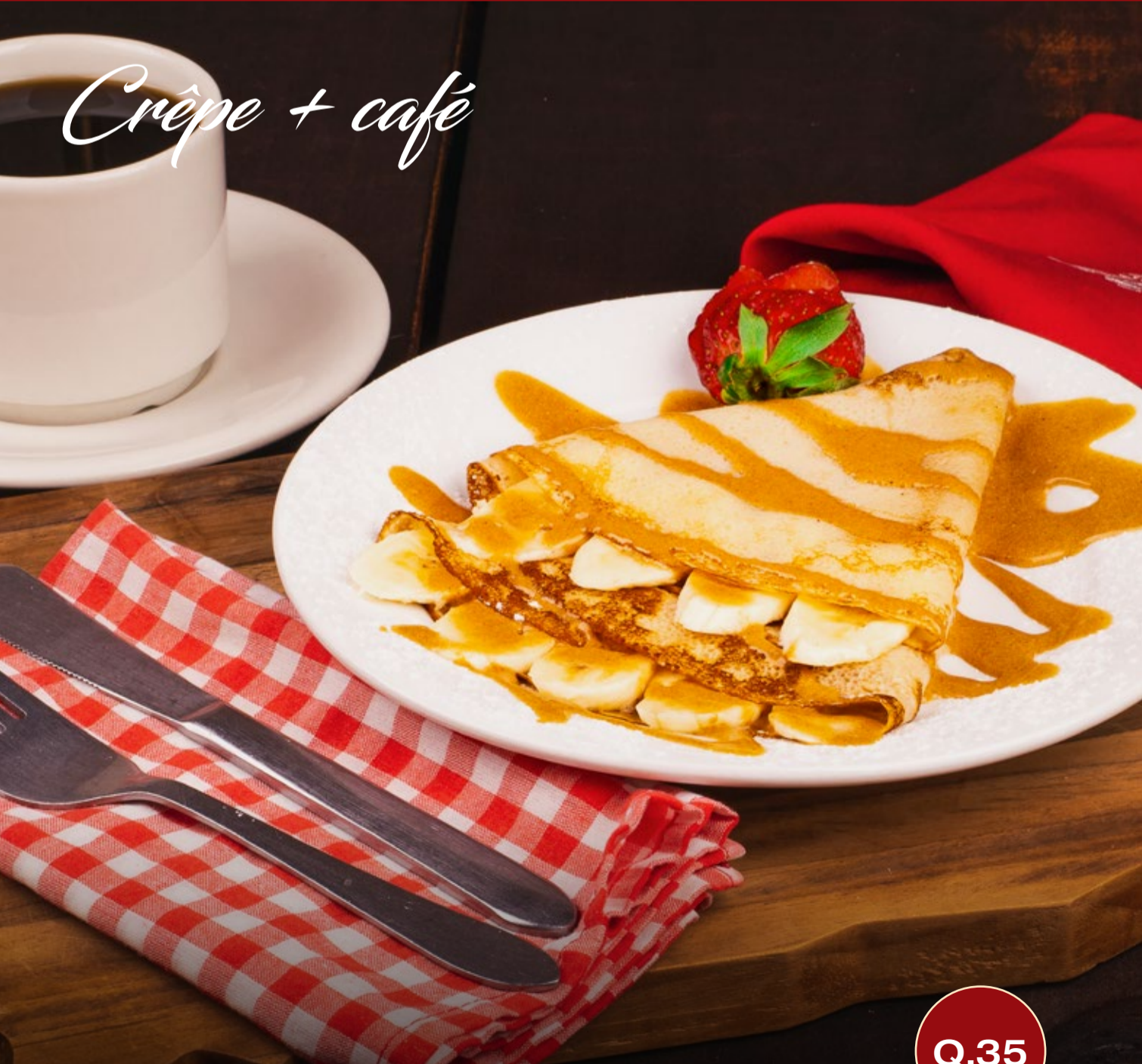
Crêpe + café