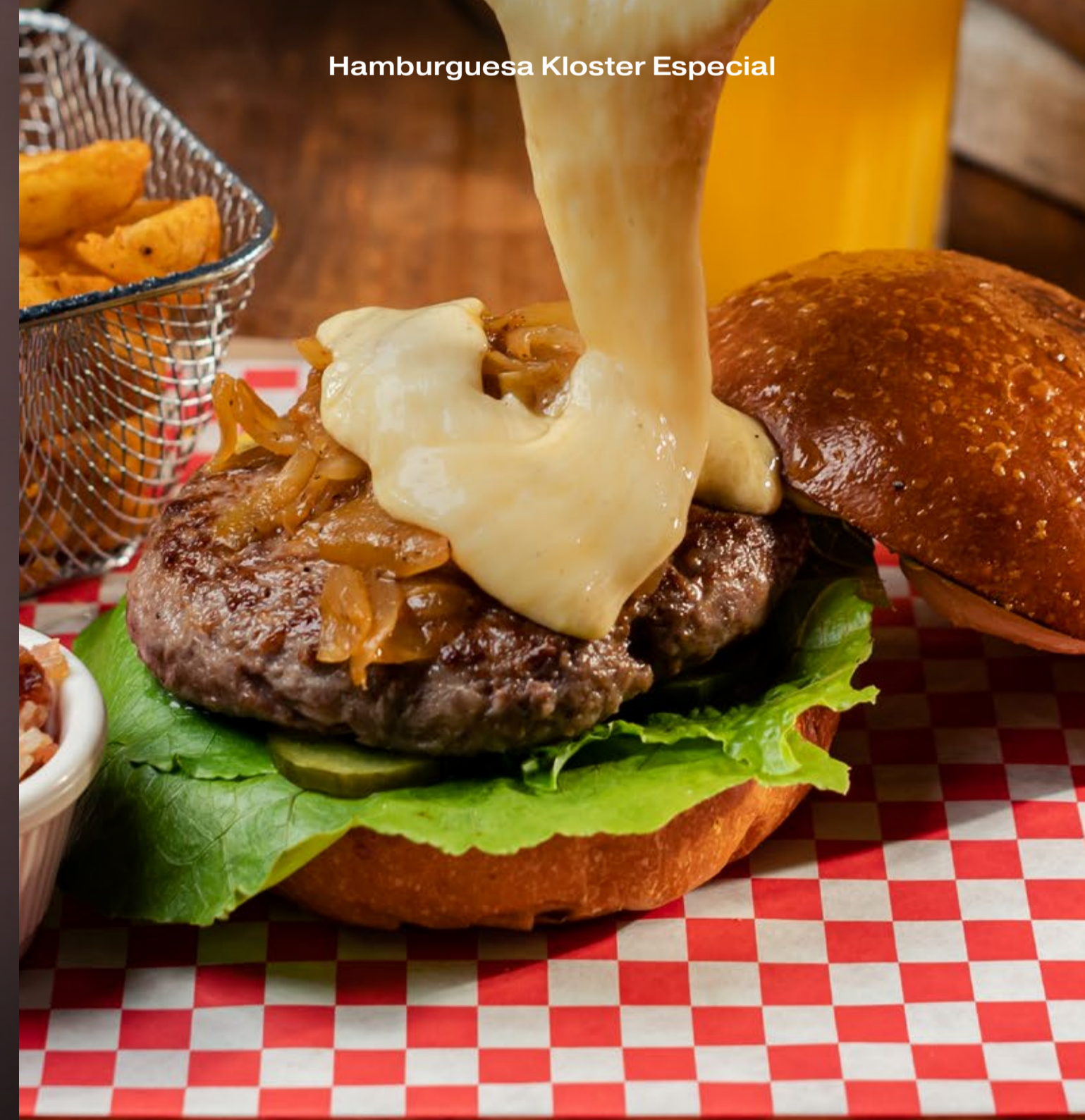
Hamburguesa Kloster Especial

VÁLIDO DE LUNES A VIERNES DE 12 P.M. A 3 P.M.