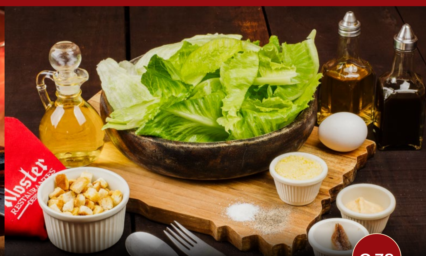
Ensalada Cesar Personal

Suave pechuga de pollo a la plancha servida con dos guarniciones y fondue-bread.