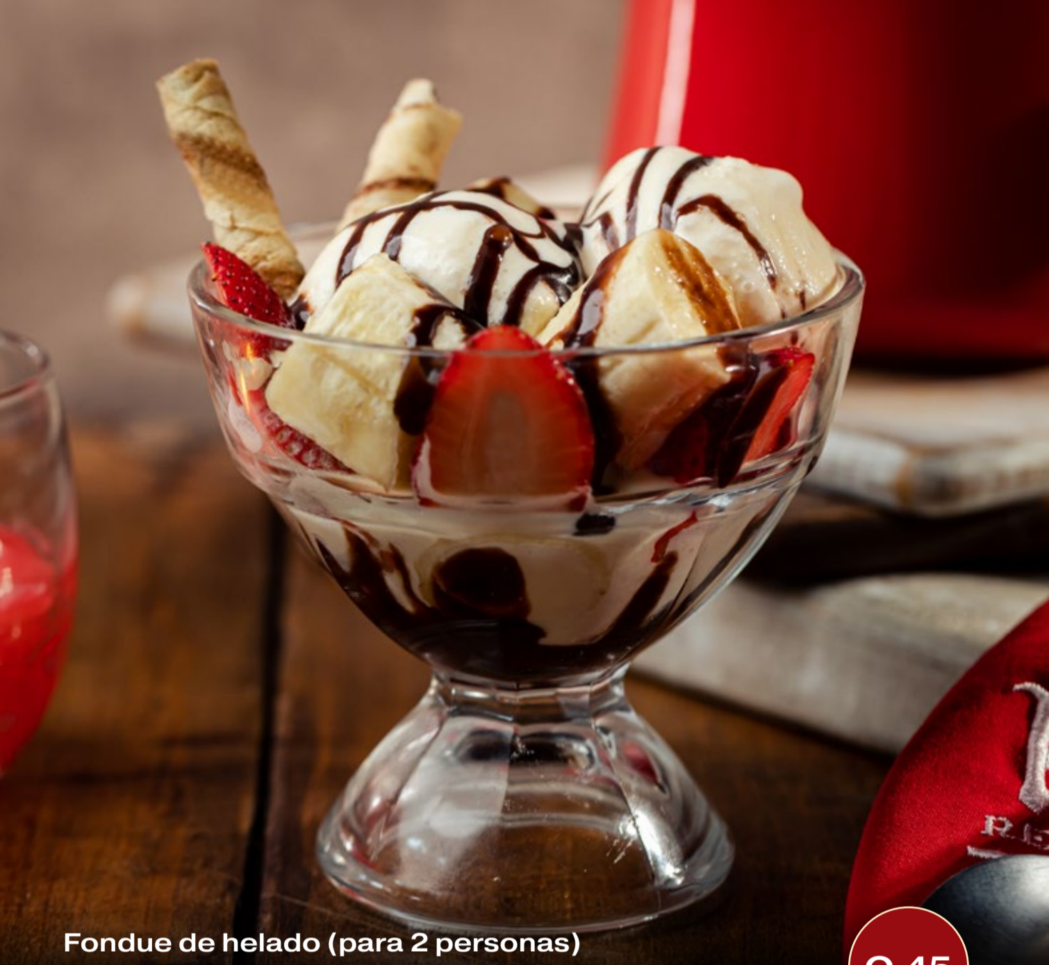
Fondue de helado (para 2 personas)

2 bolas de helado de vainilla en una cama de Fondue de Chocolate con fresa y banano bañado con fondue de chocolate Kloster.