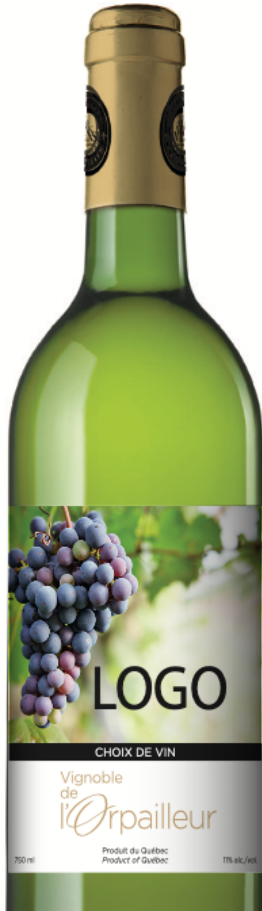
VOTRE VISUEL - Vin blanc, rosé et rouge (3.75" x 4.5")