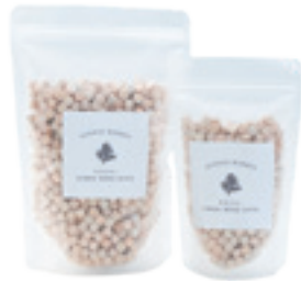
商品名：HINOKI WOOD CHIPS ヒノキウッドチップス 内容量：210g / 80g

爽やかで清涼感のある香りが特徴の高知県産「土佐ヒノキ」を7mm角の粒状にした天然のフレグランス