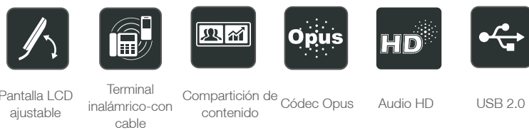
Pantalla LCD ajustable

Diseñado especialmente para ejecutivos y profesionales ocupados, el terminal premium empresarial Yealink SIP-T53 es fácil de usar con una pantalla gráfica LCD ajustable de 3.7 pulgadas que le permite encontrar de manera fácil y flexible el ángulo de visión cómodo dependiendo de las necesidades personales y ambientales. Funcionando con los adaptadores USB de Bluetooth y WiFi, Yealink BT40 y WF40/WF50, el teléfono IP SIP-T53 garantiza mantenerse al día con la moderna tecnología inalámbrica y aprovechar cada oportunidad en la futura era inalámbrica. El puerto USB 2.0 integrado, permite la grabación, conexión de auriculares USB con cable o inalámbricos o de hasta 3 módulos de expansión EXP50. Beneficiándose de estas características, el Yealink SIP-T53 es un terminal potente y expandible que ofrece una óptima eficiencia y productividad.