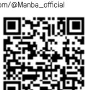
anki tutorial video link