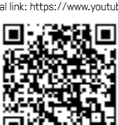
YouTube official link

Mapped button using anki tutorial video link: https://youtu.be/nHTZIB2DE1w YouTube official link: https://www.youtube.com/@Manba_official