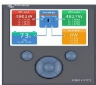
Color Control GX