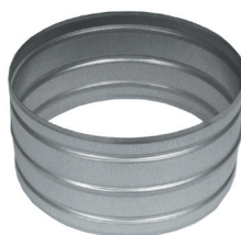
Conector para EM 13 Ref. EM 13330