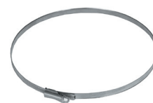
Abrazadera para EM 13 Ref. EM 13430