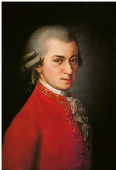
Wolfgang Amadeus Mozart

In deel vier laat Ligeti het beest echt los. Het deel duurt nog geen twee minuten en is een eruptie van agressieve akkoorden waarin hij al het voorgaande samenperst. Maar ook hier worden deze explosies afgewisseld met hele stille lange noten, waarin de spanning om te snijden is. Ligeti schrijft in een voetnoot bij dit deel dat het de bedoeling is dat veel