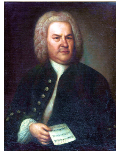
Johann Sebastian Bach

verwijderde harmonische uithoeken. Het vierde deel is een staaltje contrapuntisch meesterschap dat zijn weerga niet kent. Niet alleen componeerde Mozart twee geniale fuga's, hij laat deze twee fuga's ook nog eens tegelijk klinken. De chromatische stijgende lijn die in alle delen al