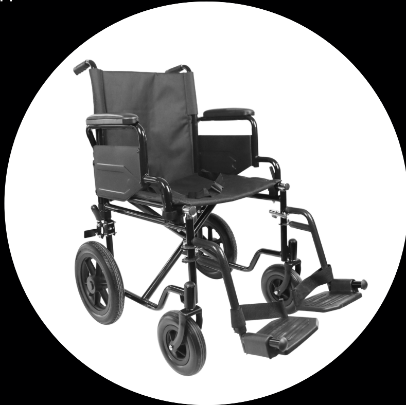
PEPE - TRANSPORT WHEELCHAIR PEPE - SILLA DE RUEDAS TRANSPORTE PEPE - TRANSPORTROLLSTUHL PEPE - FAUTEUIL ROULANT DE TRANSPORT PEPE - CARROZZINA DA TRASPORTO