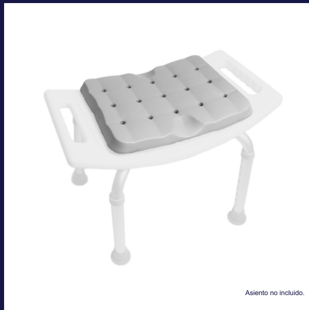
Asiento no incluido.