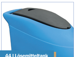
44 l Lösemitteltank 60 l Abwassertank