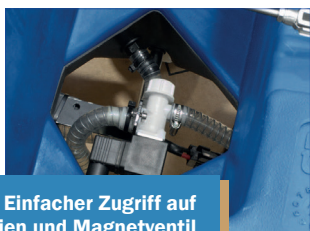
Einfacher Zugriff auf Batterien und Magnetventil