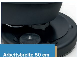
Arbeitsbreite 50 cm