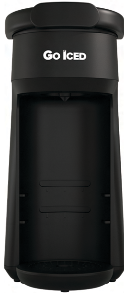
GO ICED CLASSIC™