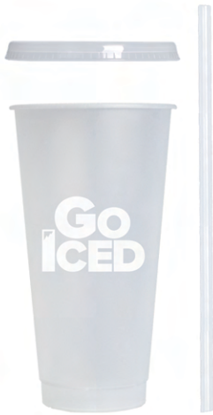
ICED CUP™ (CON TAPA Y PAJITA)