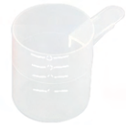
CUCHARAS DE CAFÉ