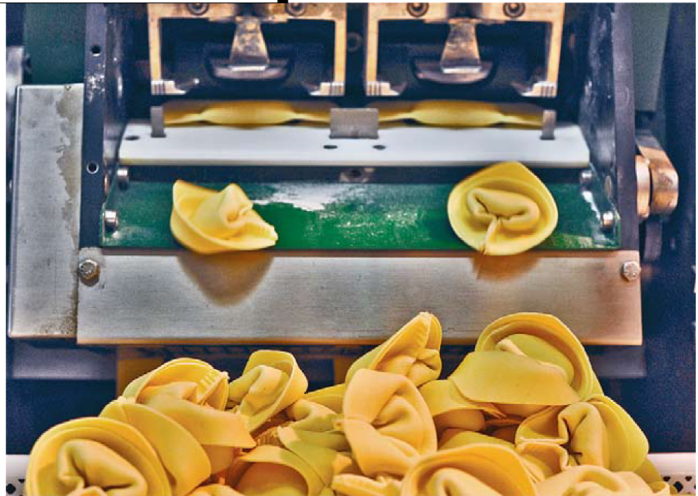
במפעל של פסטה דלה קזה. הידע ממפעל משפחתי קטן בצפון איטליה