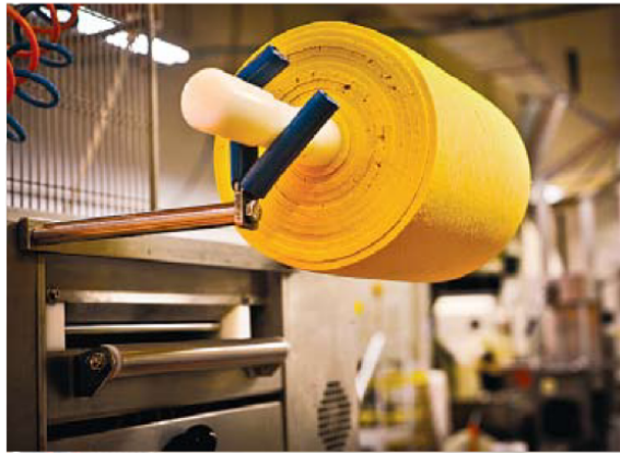
בראל. פסטה מגיל ארבע. פסטה קרולה (מימין): הכנה ידנית

מסירים מהלהבה, ובעזרת בלנדר ידני טוחנים את הרוטב החם עד לקבלת רוטב אחיד בצבע ירקרק רענן; אפשר גם במעבד מוון. מבשלים את הרביולי, מסננים ומעבירים לרוטב. מבשלים יחד עוד כדקה. מפזרים פרמזן מגורר, ומגישים. מתכונים באדיבות פסטה דלה קזה