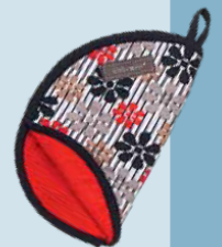
ניס חימום. להפשרת מאפים במיקרוגל

לפני יותר מחמש שנים, היינו הראשונים בארץ שסיפרנו כאן ופרגנו עד מאוד לפיתוח מקורי של יזימת ישראלית, שכיתתה רגליה בשווקים, חיפשה ובדקה ותפרה וספגה וכיבסה וייבשה עשרות סוגים של בדים וספוגים, עד שהביאה לעולם את "דיש וויש" - משטח לייבוש כלים, שנועד להחליף את אותה מגבת רטובה המונחת על השיש לאחר רחיצת הכלים, נכשלת פעם אחר פעם במשימת הספיגה, נהפכת במהרה למקומטת, ואיך נאמר זאת בעדינות, אך בישרות - מסריחה.