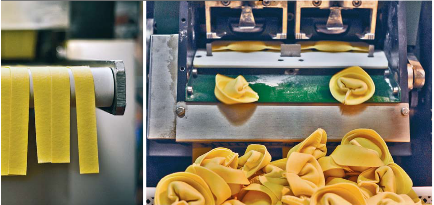
מפעל של פסטה דלה קזה. הידע ממפעל משפחתי קטן בצפון איטליה