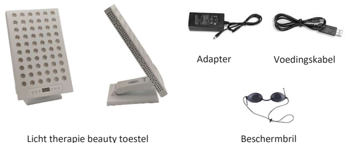
Licht therapie beauty toestel