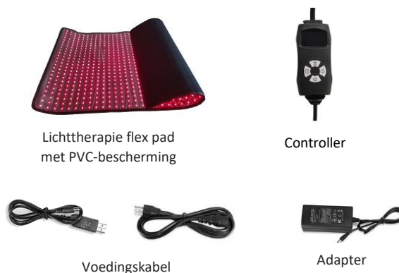
Lichttherapie flex pad met PVC-bescherming