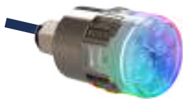
Optique lumineuse Mini-BRiO Mini-BRiO lighting unit