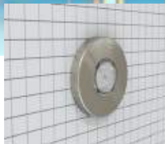
Mini-Nova - enjoliveur inox Mini-Nova - stainless steel bezel