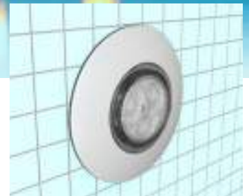
Installation sans enjoliveur Installation without bezel